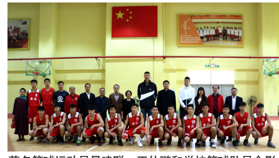
著名篮球运动员易建联、王仕鹏和学校篮球队员合影