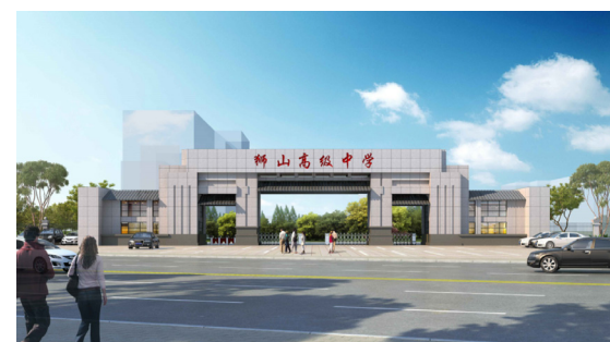
狮山高中新校门(效果图)