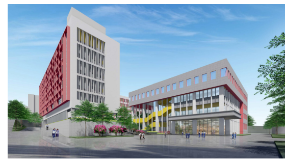
狮山高中新教学楼、新饭堂(效果图)